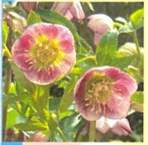
↑写真はイメージです

クリスマスローズ好きに知らない人はいない岐阜県郡上市にある「大和園」さん。特に美しい花形と繊細な色合いの品の良いシングル(一重咲き)は全国の愛好者の注目の的ですよ!! 少量ですがようやく入荷できました!! この機会をお見逃しなく!!